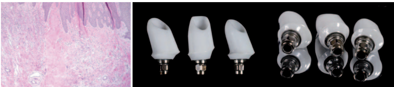
Abb. 1: Pseudo-hemi-desmosomale Weichgewebsstruktur an einem Zirkonabutment (Cercon/XiVe, Fa. DENTSPLY Friadent). – Abb. 2a und b: Individuelle Abutments, Titan-Zirkon gelötet (Hot Bond Fa. DCM, Aesthetic Base/XiVe, Fa. DENTSPLY Friadent).

Herstellung jeder Implantatprothetik spielt. Durch moderne CAM/CAM-Techniken ist heutzutage bei der Abutmentindividualisierung eine dreidimensionale Ausdehnung von Implantatabutments kein Problem mehr. Aus biologischen Gründen ist weiterhin die Verwendung von Zirkon in dem sogenannten Durchtrittsbereich unumgänglich. Durch die Weichgewebsanlagerung an das Zirkon können „Pseudo-hemi-desmosomale“ Attachments (siehe Abb. 1) entstehen. Das zirkuläre Weichgewebe am Implantatpfosten lagert sich also ähnlich wie an echten Zähnen bindegewebig an. Diese Form des Attachments bildet die natürlichste und belastbarste Form der Weichgewebsanlagerung. Es bilden sich kleine Bindegewebsbrücken, die fest an der Zirkonstruktur anhaften. Warum also nicht? Da die Verwendung von reinen Cerconabutments strikt auf den Frontzahnbereich limitiert ist, konnten bisher also im Seitenzahnbereich lediglich reine Titanpfosten Verwendung finden. Die Stabilität und die Friktion von Titanabutments im Bereich der Implantatverankerung weist allerdings die höchste Verlässlichkeit auf. Hiermit ist ein Titan-keramischer Pfosten die sinnvollste Entwicklung. Um eine dreidimensionale Durch-