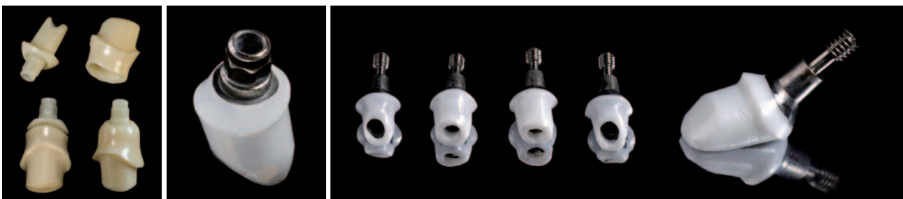
Abb. 3: Cercon Abutment (XiVe, Fa. DENTSPLY Friadent) Keramik mit gelötetem Durchtrittsprofil aus Zirkon (Fa. DCM, Rostock). – Abb. 4: Titankeramisches Abutment (Fa. DENTSPLY Friadent) mit aufgelöteter Sekundärstruktur, emergenzprofiliert. Jedes Einzelne ist ein Unikat. – Abb. 5a und b: Titan-keramische Abutments mit Ankylospfosten, jeder ist ein „Einzelstück“ (Fa. DENTSPLY Friadent, Fa. DCM Rostock).